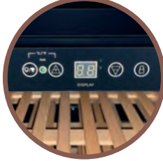
CONTROLLORE ELETTRONICO ELECTRONIC CONTROLLER