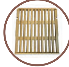
9 + 1 RIPIANI IN LEGNO 9 + 1 WOOD SHELVES