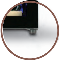
4 PIEDINI 4 ADJUSTABLE FEETS