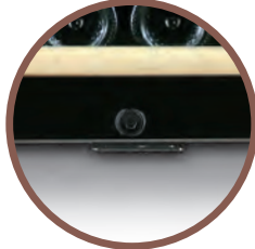
CHIUSURA A CHIAVE LOCKING SYSTEM