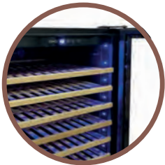
LUCI INTERNE BLU INTERNAL BLUE LED LIGHTS