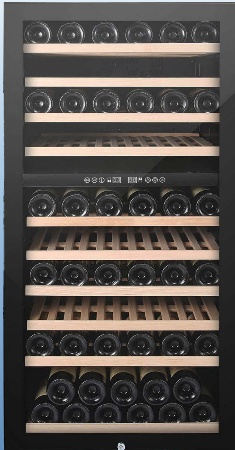
SCARLET 298V 2T