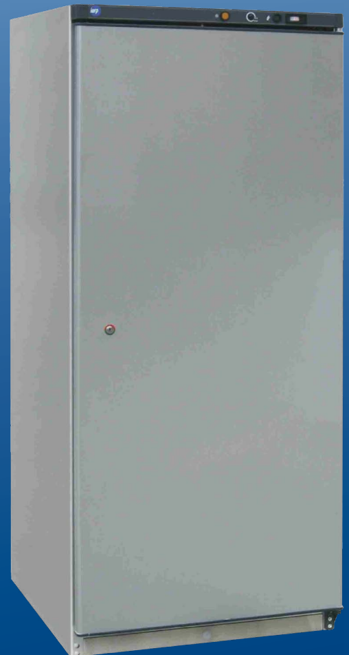
ABX 600 N